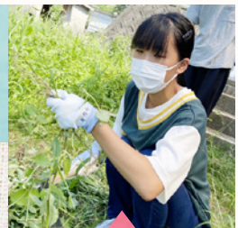
里山オレンジハウス