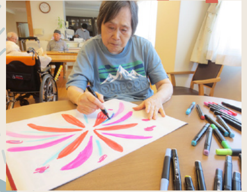
好きな色で花火を描いてみました。

お盆の時期のおはぎ作りでは「主婦だったけん、これくらいは出来るよ」と、板についた手つきで作られていました。