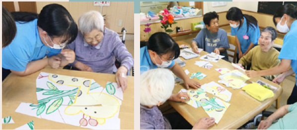
グループホーム里山