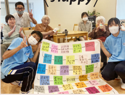
小規模多機能ホーム里山