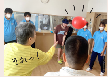
里山オレンジハウス